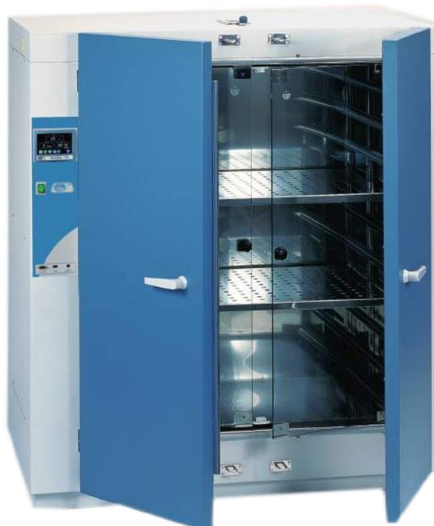
Modèles codes 200023

Note: Homogénéisation optimale de la température s'obtient avec une distribution raisonnable de l'espace et de charge, ne dépassant pas les 70% du volume utile.