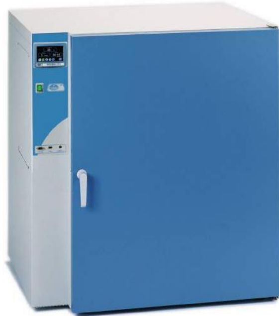
Modèle code 2000238.

Pour codes 2000239 et 2000240, 2 étagères.